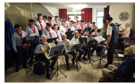
KOOR OPTREDENS WETENSWAARDIGHEDEN