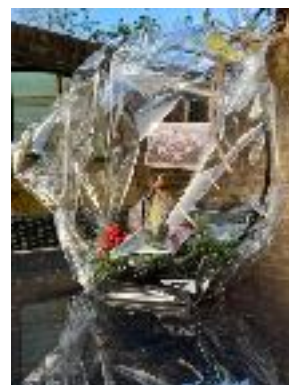
Een amaryllis bol voor onze langdurig zieken