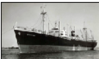
Foto containerschip 'Heemskerk'